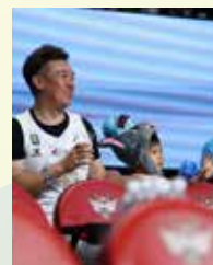
趣味 バスケットボール観戦 ゴルフ

人口減少という困難な局面においても、決して足を止めることなく、仲間を信じて前へ進みましょう。「RISE AS ONE」絶やさぬ青き情熱を胸に、愛する佐賀の未来を共に押し上げ、この最強のチームで一年間全力で走り抜きましょう。